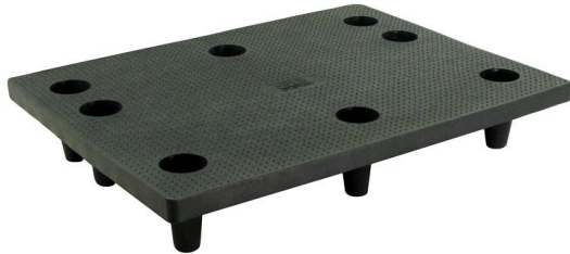
■ Wersja czarna