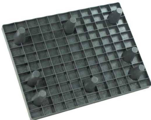
■ Dno palety