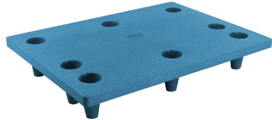
■ Wersja niebieska