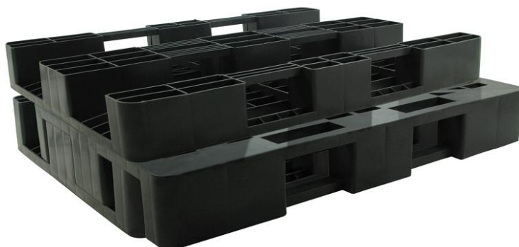
■ Sposób składowania