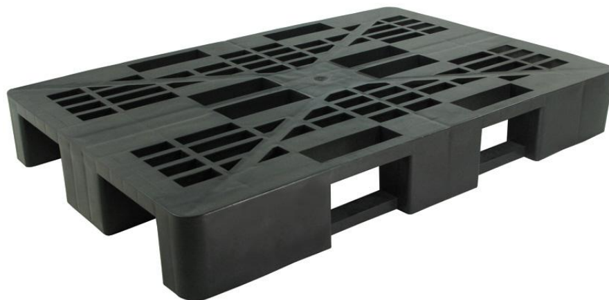
■ Paleta ażurowa