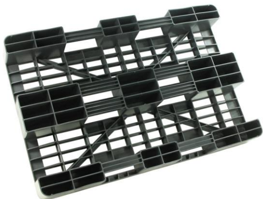
■ Dno palety